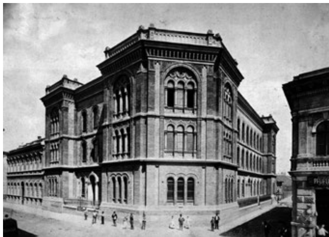
A RABBIKÉPZŐ 1877-BEN NYITOTTA MEG KAPUIT

Amikor bekövetkezett a várva várt felszabadulás, megszűnt az életveszély, de új problémák vártak a megmenekült zsidókra. Régi lakásaikat elfoglalták, ingóságai visszaszerzése gyakran nehézségekbe ütközött. Az általános bajok (élelem- és gyógyszerhiány, pénzromlás) őket is sújtották, lelki az üldöztetés emléke, hozzátartozók elvesztése még jobban, mint szomszédaikat. Nem csoda, hogy többségük kivándorlásra készült. Sajnos, az antiszemitizmus sem szűnt meg, táplálta, hogy az amerikai JOINT segélyszervezet adományai némileg enyhítették a megmaradt nyomorát és a zsidó életerő, kereskedelmi ügyesség is javított a helyzeten.