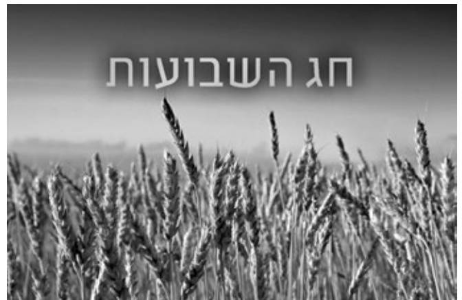
SÁVUOT A "ZSENGÉK" ÜNNEPE IS