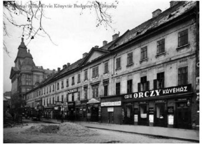
AZ ORCZY KÁVÉHÁZ HELYÉN MA A MADÁCH HÁZAK ÁLLNAK

Az 1894-ben megnyílt New York kávéház a New York Életbiztosító Társaság épületének földszintjén kapott helyet. Az épületet Hauszmann Alajos tervezte, a kivitelezés költségeit illetően szabad kezet kapott. A márvány, a stukkók, a mennyezeti festmények arisztokratikus hangulatot kölcsönöztek a helynek. Nem szükséges részletesen be-