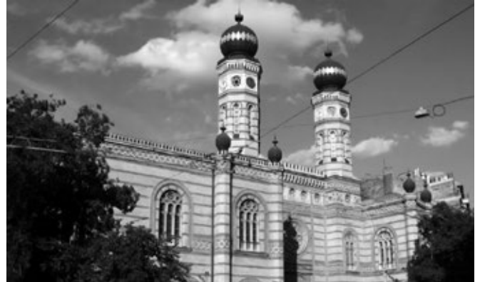
A NEOLÓG ZSIDÓSÁG VILÁGSZERTE ISMERT ÉPÜLETE, A DOHÁNY ZSINAGÓGA

Némileg javult a demográfiai helyzet, több a zsidó gyermek, erősödött a vallási élet, bár sajnos a zsinagógák száma még csökken. Kulturális téren előadások, kiállítások, zsidó TV-állomás színesíti a hétköznapi életet, szép látogatottsággal. Közművelődésileg a Magyar Zsidó Kulturális Egyesület érdeme, hogy a nem vallásos zsidók is közeledhetnek identitásukhoz kulturális rendezvényei látogatásával.