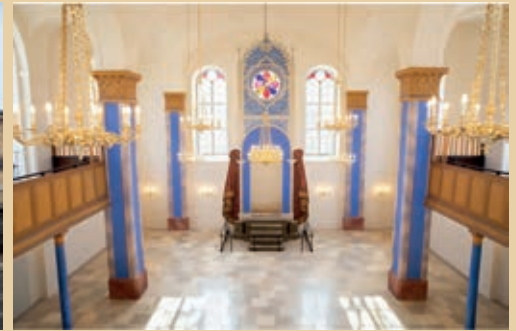
A KŐSZEGI, SOPRONI ZSINAGÓGA HOMLOKZATA ÉS A KOBERSDORFI ZSINAGÓGA BELSŐ TERE