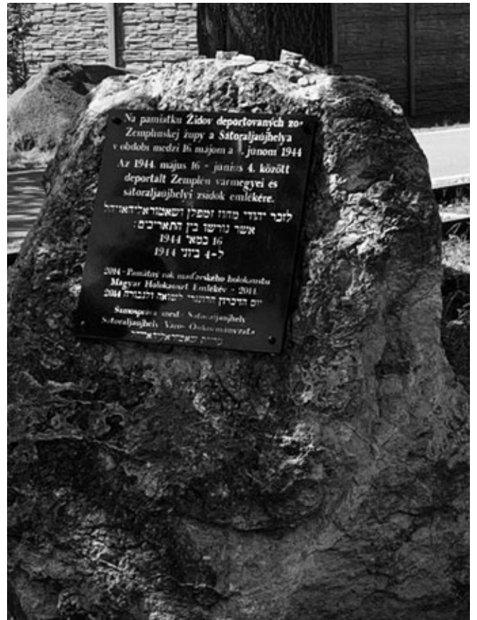
AZ 1944. MÁJUS 16-JÚNIUS 4 KÖZÖTT DEPORTÁLT ZEMPLÉN VÁRMEGYE ÉS SÁTORALJAÚJHELYI ZSIDÓK EMLÉKÉRE

(felolvasta a nagyapja naplójából 2023.06.01-én a mártír-ünnepség alkalmából Slovensko Nova Mesto-ban, ahonnan a 4 transzportot, összesen a sátoraljaújhelyi és környékbeli 15.000 zsidót útnak indították 1944 májusában-júniusában Auschwitz felé)