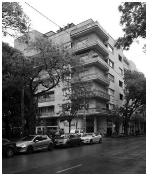
A DUNAPARK KÁVÉHÁZ IKONIKUS ÉPÜLETE

1944. március 19-én a németek, megszállták Magyarországot, már egy hét múlva bevezették a sárga csillagot és a